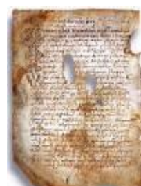
Псковская судная грамота

Двинская уставная грамота 1397 года. Мздоимство упоминается в русских летописях XIV века, например в Двинской уставной грамоте 1397 года в статье 6: «А самосуда четыре рубли, а самосуд то: кто изыснав татя с поличным, да отпустит, а себе посул возьмет, а наместники доведаются по заповеди, ино то самосуд, а опричь того самосуда нет». Там же, в статье 8: «...а черес поруку не ковати, а посула в железех не просити; а что в железех посул, то не в посул».