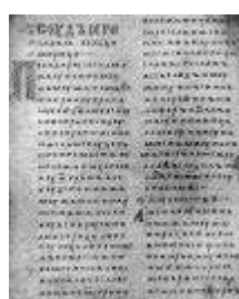
Двинская уставная грамота

Лихоимец – жадный вымогатель, взяточник».